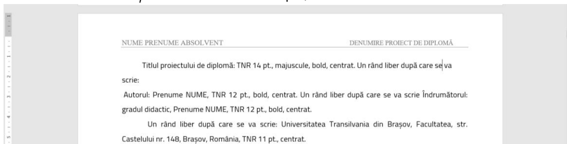
Fig. 2.2. Exemplu de redactare Header

Sub cele două informații se va trasa o linie simplă, urmată de un rând liber.