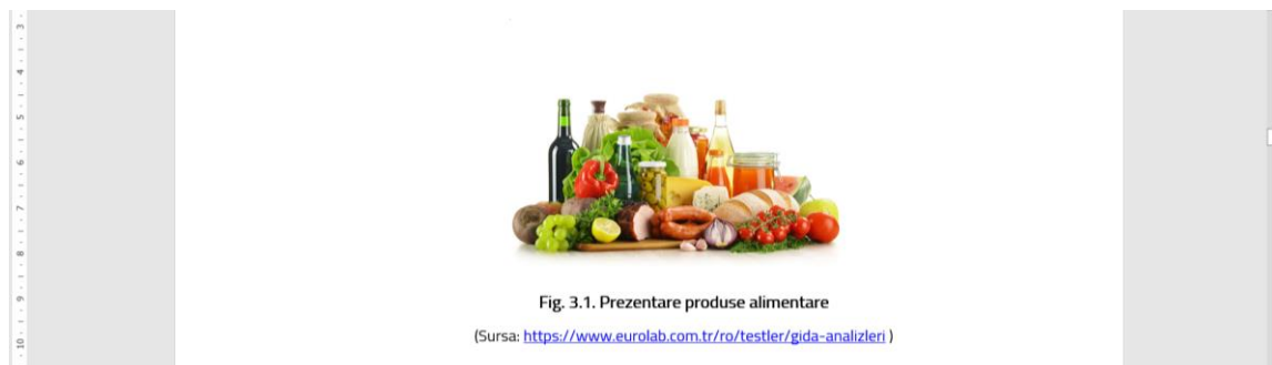
Fig. 2.4. Exemplu de redactare figuri

Numerotarea se va face la fel ca și în cazul tabelelor, incluzând numărul capitolului (Ex: Fig. 3.1. reprezintă prima figură din capitolul 3). Dacă figura este preluată dintr-o sursă bibliografică, aceasta va fi scrisă imediat sub titlu, folosind caractere de 10 pt. (ex: Sursa: http://inra.fr ). Figurile vor fi setate "In line with text".