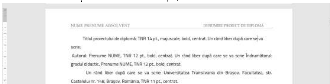
Fig. 2.2. Exemplu de redactare Header

Sub cele două informații se va trasa o linie simplă, urmată de un rând liber.